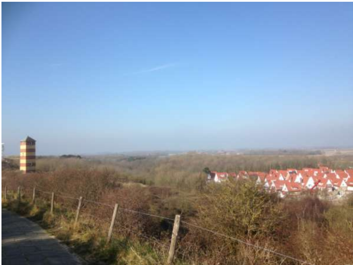
'Hotspot' Dishoek pal achter (of, nou ja, in) de duinen